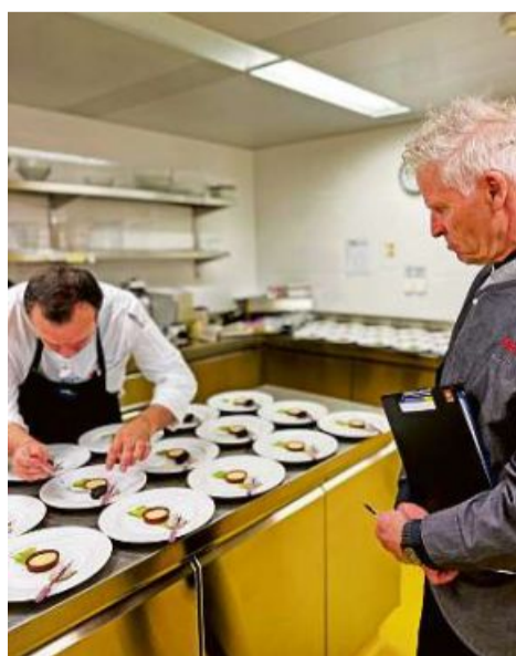
La preschientscha dalla giuria ha fatg vegnir empau gnervus.