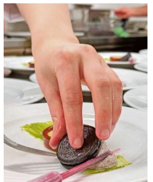
Presentaziun e gust ein impurtonts factors.