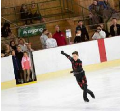
Alla gala muossan ils affons e giuvenils las piruetas ch'els han exercitau durant numerusas uras da trenament.